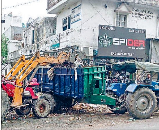
सोनीपत। गीता भवन रोड पर डंपिंग प्लांट से कूड़ा उठाते कर्मचारी।