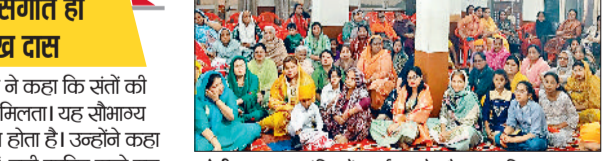
सोनीपत। कृष्ण मंदिर में कार्यक्रम के दौरान उपस्थित श्रद्धालु।