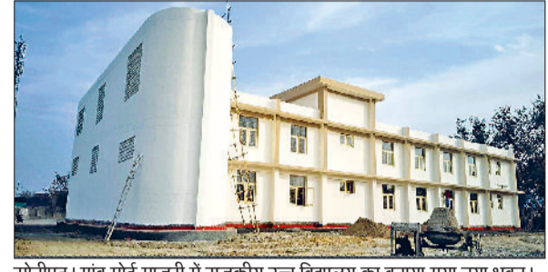
सोनीपत। गांव मोई माजरी में राजकीय उच्च विद्यालय का बनाया गया नया भवन।