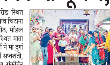
आज मां स्कंदमाता की होगी आराधना