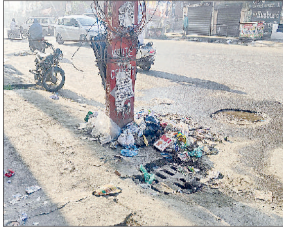
सोनीपत। लाइनपार गुड़ मंडी क्षेत्र में सड़क पर फैला कूड़ा।