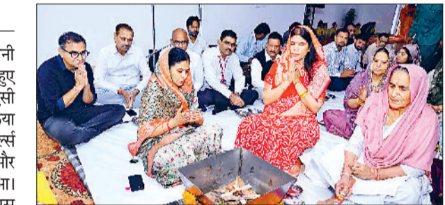
महेंद्रगढ़। हवन करते हुए।