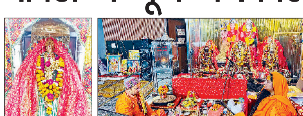
छठ की कढ़ाई कल