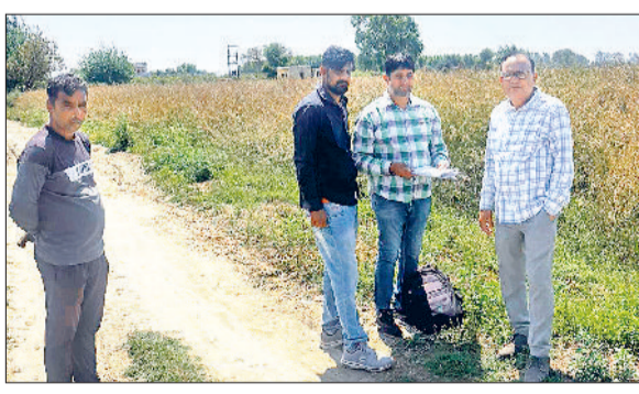
खरखोदा। औसत फसल के आकलन में जुटे कृषि अधिकारी।