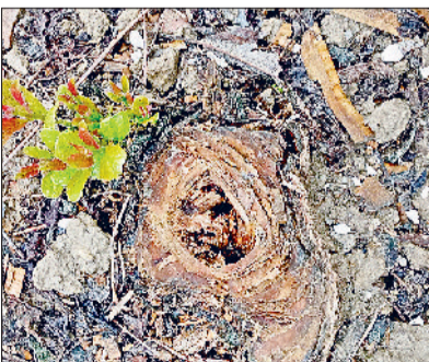
सोनीपत। कालपुर चुंगी के पास बने विश्वकर्मा पार्क में काटे गए पेड़।