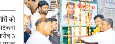
गन्नौर। वाटर कूलरों का रिबन काटकर विधिवत शुभारंभ करते विधायक।